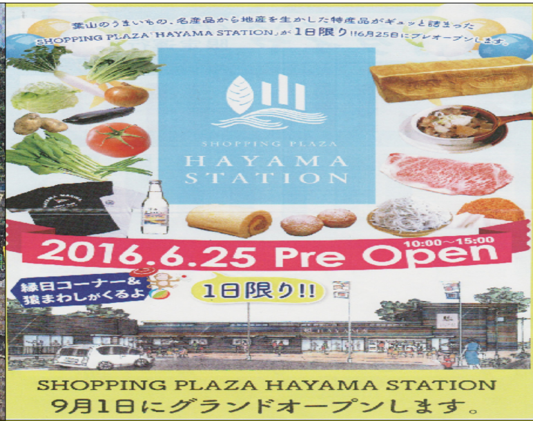
「地域交流拠点・SHOPPING PLAZA HAYAMA STATION」